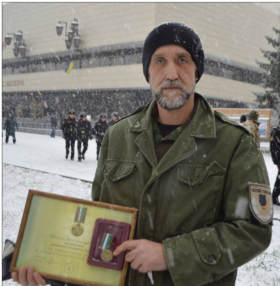
Отримання відзнаки Президента України «За гуманітарну участь в Антитерористичній операції» (м. Суми, 2017 р.)