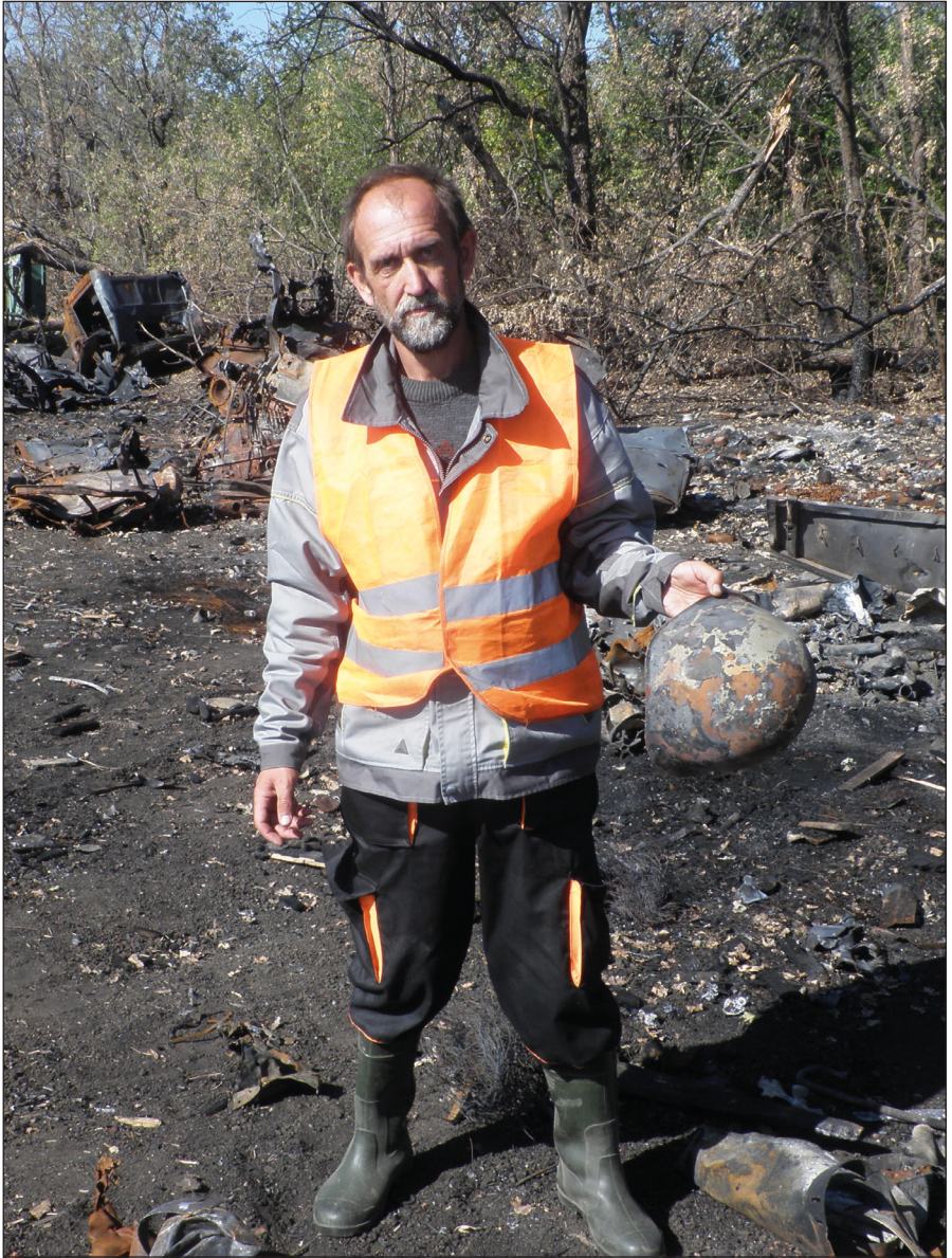
На початку роботи гуманітарної місії «Чорний тюльпан» («Евакуація – 200») під Іловайськом (вересень 2014 р.)