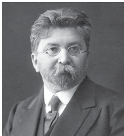
Микола Прокопович Василенко

Василенко Микола Прокопович (2(14)XI.1866, с. Есмань Глухівського пов., Чернігівської губ. – 3.X.1935) – громадсько-державний і педагогічний діяч, історик держави і права, академік, один з ініціаторів створення і другий президент ВУАН.