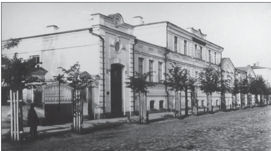
Больница Св. Евфросинии в начале XX ст.

Переходя к подробному отчёту о действиях больницы Св. Евфросинии со дня её учреждения, считая необходимым сказать, что за самое короткое время своего существования она стала