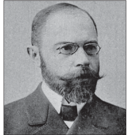
Микола Федотович Біляшівський

Біляшівський Микола Федотович (12/24.X.1867 – 21.IV.1926) – український археолог, етнограф, мистецтвознавець.