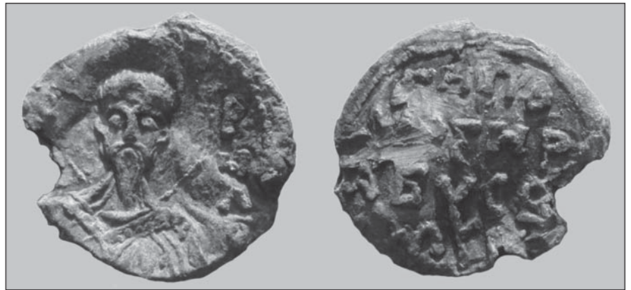
Князівська булла, знайдена на Глухівщині

У нашому випадку розміри булли становлять 20 x 20 мм. Вона вкрита світло-сірою патиною, по вертикалі має наскрізний отвір для шнура. На лицевій стороні є рельєфне зображення погруддя Святого Кирила в княжому уборі. Голова святого обрамлена німбом. Праворуч, під залишками крапкового обідка, проглядаються нерозбірливі літери. На зворотній стороні читається чотирирядковий напис «ГНПО/СНР / АБУСВ / МУ», обрамлений