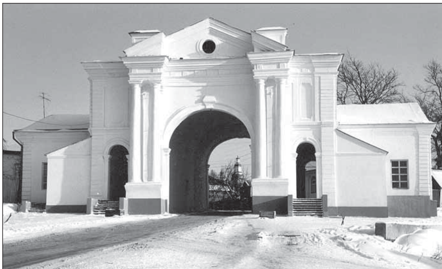
Київська брама Глухівських міських укріплень. Сучасний вигляд

Злегкої руки краєзнавців минулих часів за брамою закріпилась хибна назва тріумфальної арки, яка нібито була збудована для пишного прийому Катерини II. Насправді ж муровану Київську браму на місці однойменної дерев'яної збудував у 1766–1769 рр. архітектор Андрій Квасов. Первісно вона мала один арковий проїзд і стояла в тілі високого земляного валу, в якому частково ховалися невеличкі муровані кордегардії (приміщення для варти). У збірнику наукових праць «Сіверщина