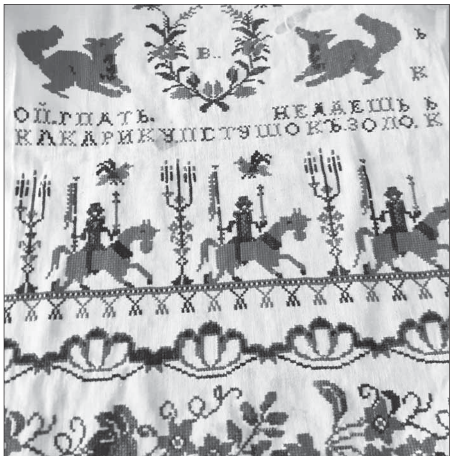
Фрагмент рушника (н/д 1246). Фонди Національного заповідника «Глухів»

На території України перші вишивки з'явилися ще за скіфів, про що свідчать зображення на творах декоративно-ужиткового мистецтва: золоті пекторалі з кургану Товста Могила IV ст. до н. е., срібної вази з кургану Чортомлик IV ст. до н. е. на Дніпропетровщині. Знаменита куль-обська ваза декорована сітчастими геометричними візерунками: ромбами, колами, хрестами. Оздоблювався вишитими орнаментами також і одяг сарматів, які тривалий час мешкали на території сучасної України. Так, у кургані Соколова Могила I ст. до н. е, що на Миколаївщині, археологи віднайшли одяг багатой сарматки, точніше його залишки, із золотим шитвом по