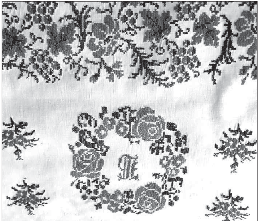
Фрагмент рушника (н/д 1241). Фонди Національного заповідника «Глухів»

На багатьох речах серед квітів зображуються птахи, які є символами людських душ. Зозулю найчастіше вишивають на гілці калини, що символізує продовження роду. Пава або жар-птиця – птах сімейного щастя, що несе в собі сонячну енергію. Шлюбну пару символізують соколи, голуби та півні (характерна ознака весільного рушника): вони або тримають у дзьобіку ягідку калини, або сидять в основі дерева-символу нової сім'ї. На рушниках із колекції Національного заповідника «Глухів» також