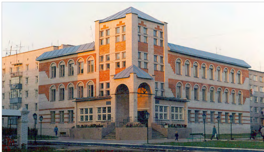
Глухівська школа мистецтв ім. М. Березовсько.

Мабуть, так романтично вважати, що Березовський у розквіті років по власній волі пішов із цього нікчемного життя. Але... Але дохід дозволяв знаходити відряду, крім того є документ, що засвідчує видачу матеріальної допомоги на поховання «скоропостижно умершого» музиканта, а не самовбивці, яких взагалі ховати на кладовищі було заборонено, а видавати гроші із державного