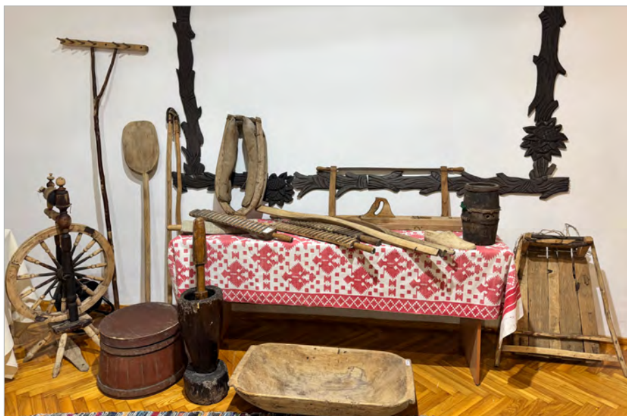
Знаряддя праці та хатне начиння у виставковій експозиції

овальна дерев'яна дошка на довгому дерев'яному руків'ї для саджання хлібів та пирогів у піч і діставання їх звідти. Широко відоме використання хлібної лопати в народній медицині при «переробленні» або «перепіканні» хворої дитини, яка «не допеклася» в утробі. Новонароджену дитину укладали на хлібну лопату (а іноді ще й загортали у тісто) і саджали в піч так само, як хліб, щоб дитя «допеклося» і нібито народилося заново.