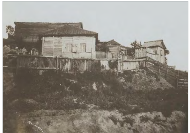
м. Глухів, вул. Валова. Початок ХХ ст.

1911 р. «Сиреньке життя. Чи знайдеться таке місто, що зрівнялось би з нашим «градом» Глуховом, який почив «сном праведника»? Певно – ні. Правда, Глухів в 1907, 1908, 1909 роках пишався своїм розвитком. Багацько тоді було зроблено на «полі убогої ниви». Але настала прохолода і все щезло, сліду не зосталось. І от тепер свіжій людині не можна жити у Глухові, бо треба завше спати. І ніщо не розбуджує нашого «града». Даремно, що Глухів мав багацько шкіл, але учні їх всі заклопотані вивчити «от сюда до сюда». Інтелігенція ж Глухова блаженствує над картами, в клубах. Щоб зробити що користне, то й з свічкою нікого не знайдеш. Були у нас, правда, і товариства, що приносили користь, але їх треба вже лічити «не отъ міра сего». Так, була «Лига образования», що у 1908 та 1909 роках завела вечірні заняття з дорослими робітниками і багатьох навчила гра-