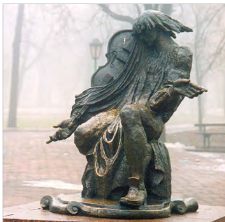
Пам'ятник М. Березовському у Глухові.

Дуже тут віє моцартівським «Реквіємом». Люблять у нас узагальнювати. Виходячи з міфу 3 та 4, Березовський не думав прощатися із життям, а концерт «Не отвержи мене во время старости» написаний у юні роки композитора. Критики забули, що Максим – геній, і написати такий глибинний твір для нього – справа п'яти умовних хвилин. Тому і віднесли час написання концерту на кінець життя – коли вже мудрий митець створив таку глибу. Але хіба 30–40 років то є вік мудрості?