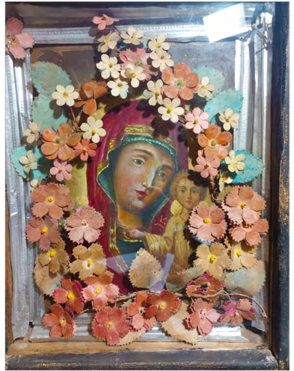
Ікона Богородиці з немовлям в обрамленні весільного вінка. Національний заповідник «Глухів», тимчасове зберігання

Уперше дівчині плела вінок її матері, коли дитині виповнювалося три