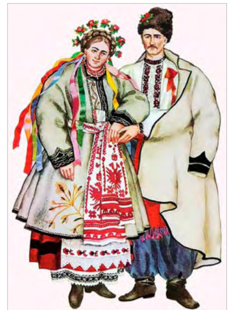
Чернігівщина. Весільне вбрання

приносять молодятам сніданок: хліб, холодець, смажену курку і таке інше. Дорогою дружки співають: ➡➡➡