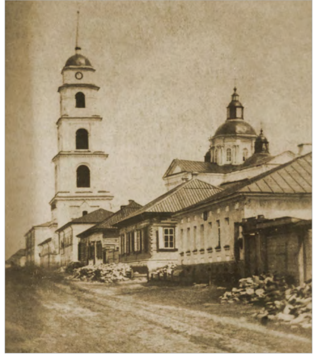
Глухів на початку ХХ ст. Вулиця Києво-Московська

1908 р. «Діяльність якогось народу в справі оберігання здоров'я цілої громади можна прийняти за міру того, скільки цей народ здатний грати якусь роль в історії культури». Ці слова Петенкофера не дуже прийшлися б до вподоби нашим «батькам города», які старанно удають, ніби вони щиро дбають про здоров'я городян і санітарний стан міста. Справді, влітку Глухів на зверхній погляд справляє не погане вражіння. Перед вами чепурненьке провінційальне місто, з добре брукованими вулицями, з «газокалійними» лихтарями, бульварами, непоганим міським садом і іншими ознаками культури. Але загляніть на передмістя (особливо Салдатську Слободу, Веригин і Усовку), а навіть на підвір'я центральної частини міста і вас здивує глузування з початкових правил громадської гігієни. Чималенькі грошики витрачаються на окраси міста, а подбати про постійну очистку міста, особливо базарів і майданів нема ні часу, ні