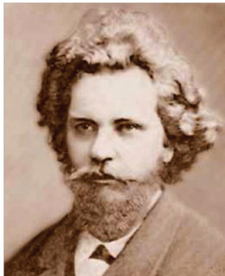
Федір Михайлович Уманець у студентські роки

Федір Уманець народився 21 лютого (5 березня) 1841 р. в селі Янівка Глухівського повіту Чернігівської губернії. Мав козацько-старшинське походження, що зумовило раннє його знайомство з історією України, традиціями громадського устрою та місцевого самоврядування. Навчався в Новгород-Сіверській гімназії та Московському університеті, де здобув вищу юридичну освіту, а в 1862 р. захистив дисертацію «Наділ общини та дворові люди». Саме під час навчання в університеті відбулось формування його світогляду як прихильника розвитку та розширення прав міс-