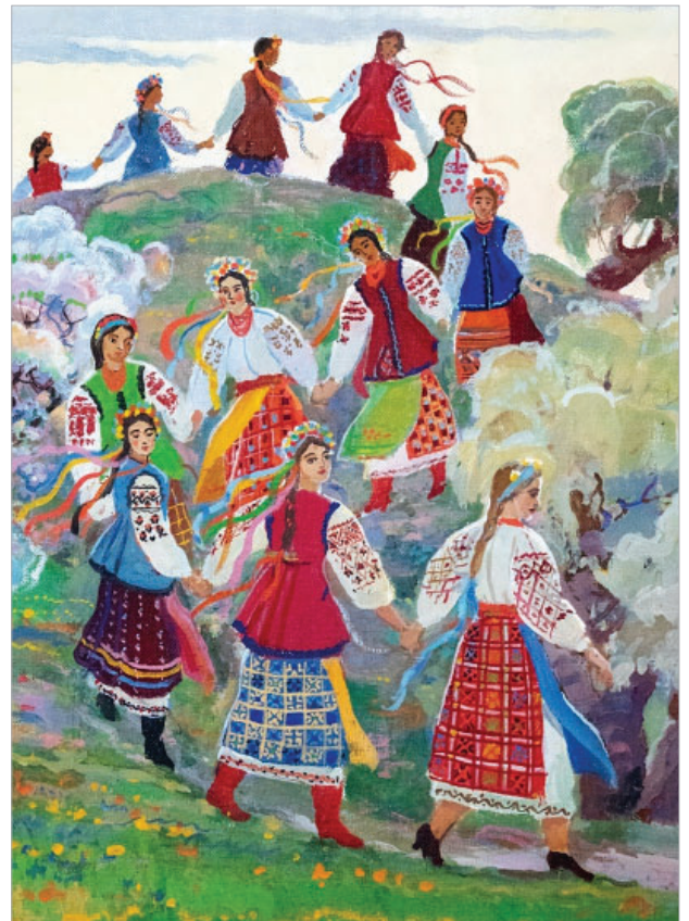
І. Гончар. Кривий танець (1970-ті рр.)

22 Апреля. В страстную субботу, во время обхода вокруг церкви и стоя у западных ее врат, когда в церкви никого нет, Ангелы выводят Спасителя из гро-