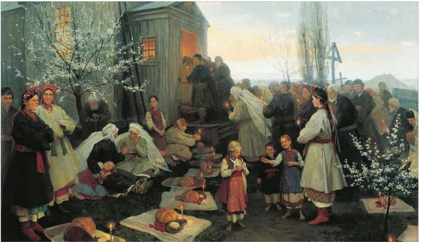
М. Пимоненко. Ранок Христового Воскресіння (1891 р.)

в красную краску яйцами; эти яйца гусятинные и куриные. Прибавьте к этому несколько сортов водок и наливок; тут есть и перчиковка, и калгановка, кардамонная, кусака, и сливянка, и малиновка, рябиновка и терновка.