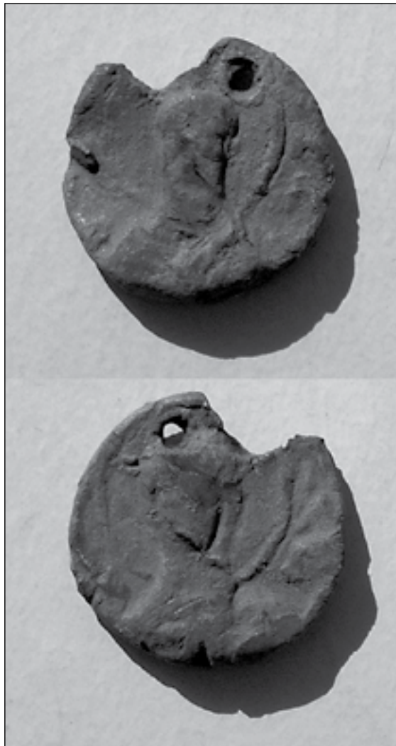
Висла печатка Агафії (Марії) Мстиславівни

Розмір булли становить 20 x 20 мм. Вона вкрита сіро-жовтою патиною, по вертикалі має наскрізний отвір для шнура. На лицевій стороні проглядається рельєфне зображення св. Кирила. Його голова обрамлена німбом, на обличчі – борода. Над головою знаходиться наскрізний округлий отвір.