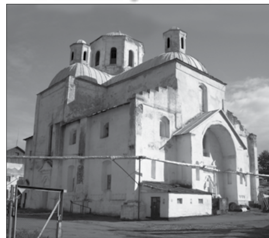
Собор Різдва Пресвятої Богородиці Гамаліївського монастиря. Сучасний вигляд.

Документ, який наводиться нижче, доповнює вже виявлені джерела з історії Гамаліївської обителі, зокрема її братії та ролі в духовному та культурному житті Глухівщини XVIII ст.