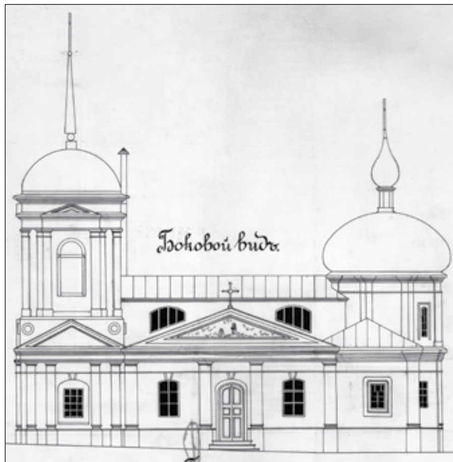
Кресленник Покровської церкви, 1910 р.

У 1708 році цар Петро I жалує грамоту на сільце Білокопитове сину Олексія Заруцького – Афанасію. Віктор Вечерський стверджує, що часом побудови церкви є 1737 рік, а його колега, архітектор Володимир Биков, уточнює, що її будівництво відбувалося упродовж 1737–1741 років. Але до рук дослідників не потрапили