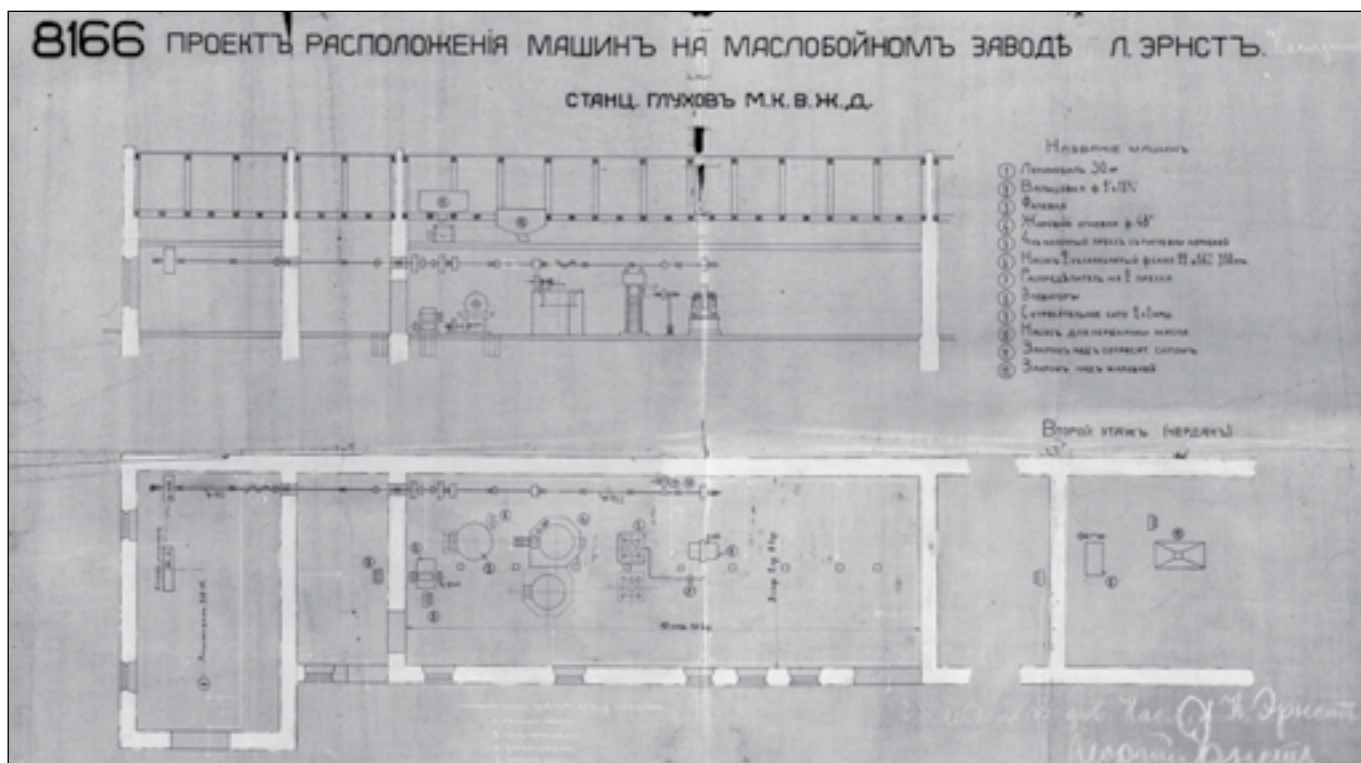
Проект розташування машин на реорганізованому заводі Ернстів (ДАЧО, ф. 127, оп. 10, спр. 2876)

Справа містить план місцевості і кресленник заводу, які дозволяють установити його місце знаходження (вул. Гоголя, територія колишнього