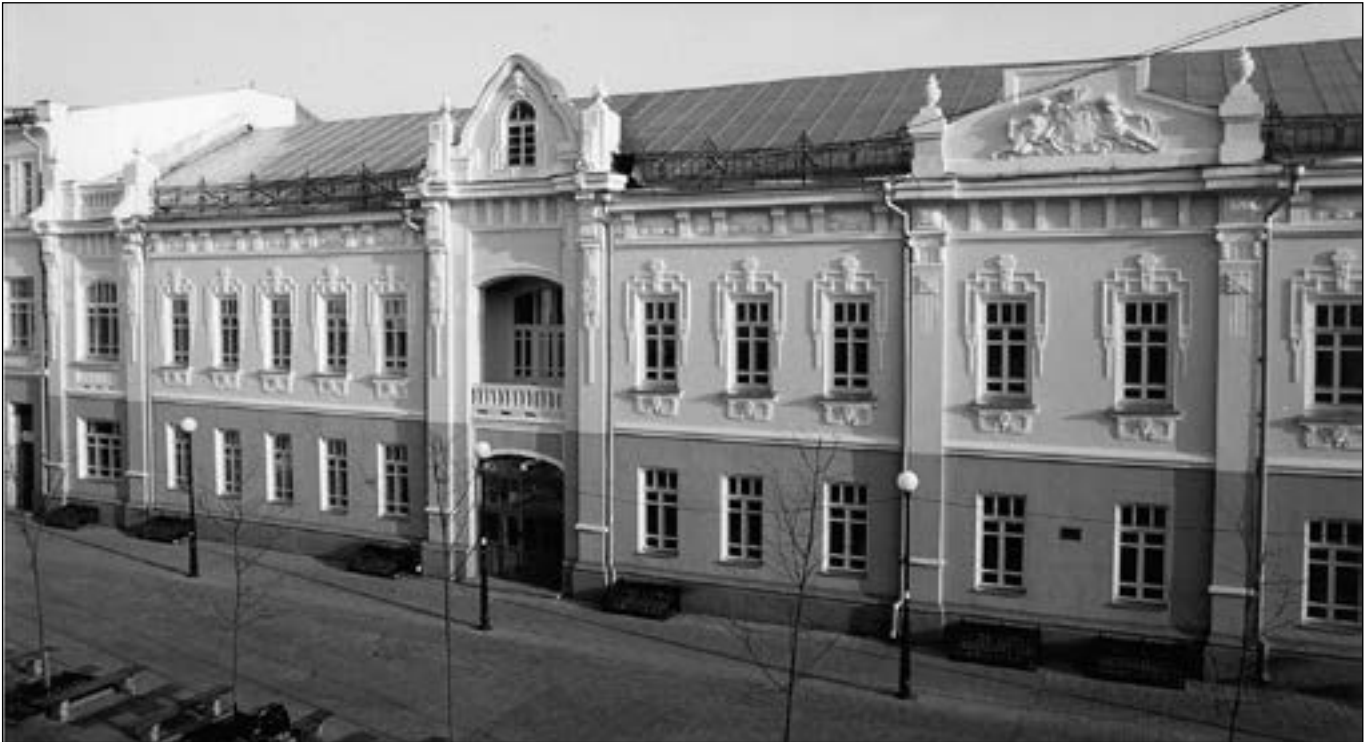
Будинок міської думи (1912–1913 рр.), у якому нині розташований Професійно-педагогічний коледж Глухівського НПУ ім. О. Довженка

не представления означенных книг, оказалось, что все эти книги находятся в неисправности и существуют только номинально. Например: а) в книге о паспортной бумаге не занесено ни прихода, ни расхода за весь декабрь;