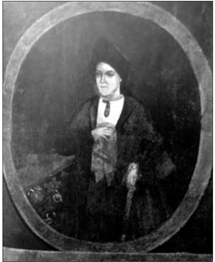
Портрети Івана Ілліча та Анастасії Марківни Скоропадських із Гамаліївського монастиря

Досліджуючи полотно із зображенням самої гетьманши, О. Ковалевська припускає, що її портрет виконаний тим же майстром (однією рукою), що і портрет Івана Скоропадського. Портрет Анастасії Марківни знаходився поряд із портретом Івана Ілліча і є парним до чоловічого та написаний одночасно з ним, так би мовити, наперед, бо вона померла через 7 років після смерті чоловіка. На полотні фігуру Анастасії зображено біля столу, вкритого яскравим килимом із рослинним орнаментом. Вона одягнута у традиційний парадний одяг козацької старшини: білу сорочку з вишитою планкою, жупан та кунтуш, підбитий хутром. Обличчя Скоропадської вражає своїм зосередженим поглядом та напружено стуленими губами.