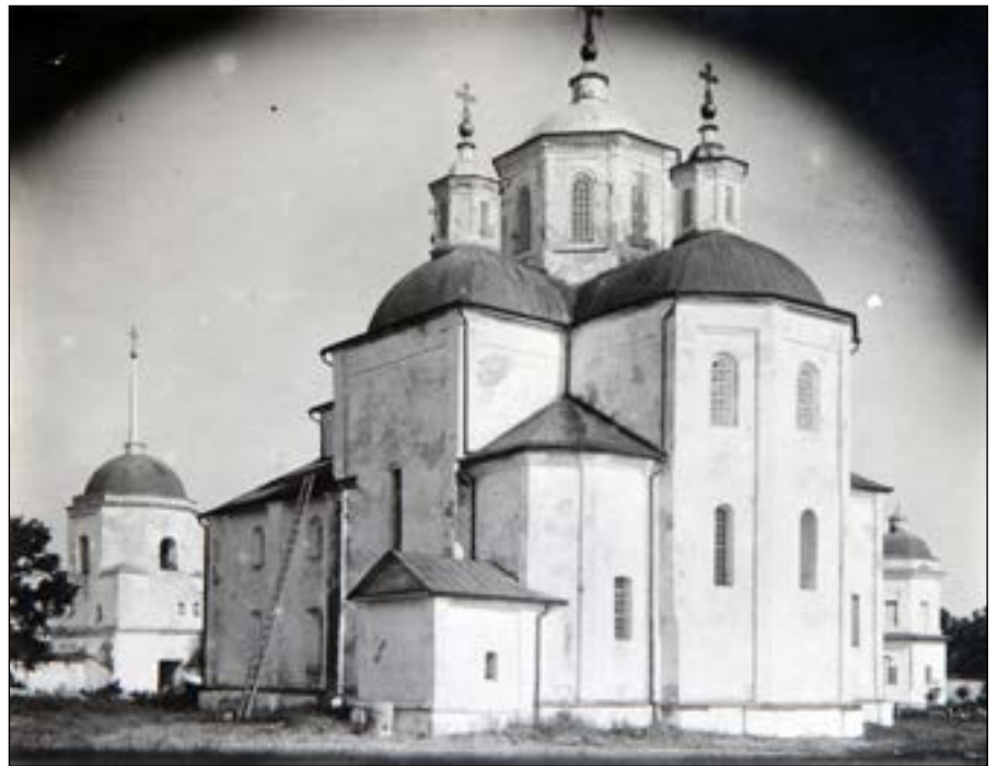
Собор Різдва Богородиці Гамаліївського монастиря. Фото 1930-х років