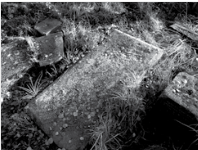
Фрагменты памятников на месте могил Есманских

На сегодняшний день все сохранившиеся памятники купцов Есманских на глуховском еврейском кладбище разрушены, отдельные фрагменты от них разбросаны на месте могил членов этой семьи. Между тем, эпитафия надгробия гласного город-