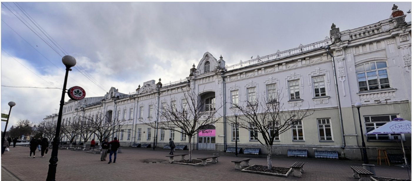
Пам'ятка архітектури «Будинок міської думи»