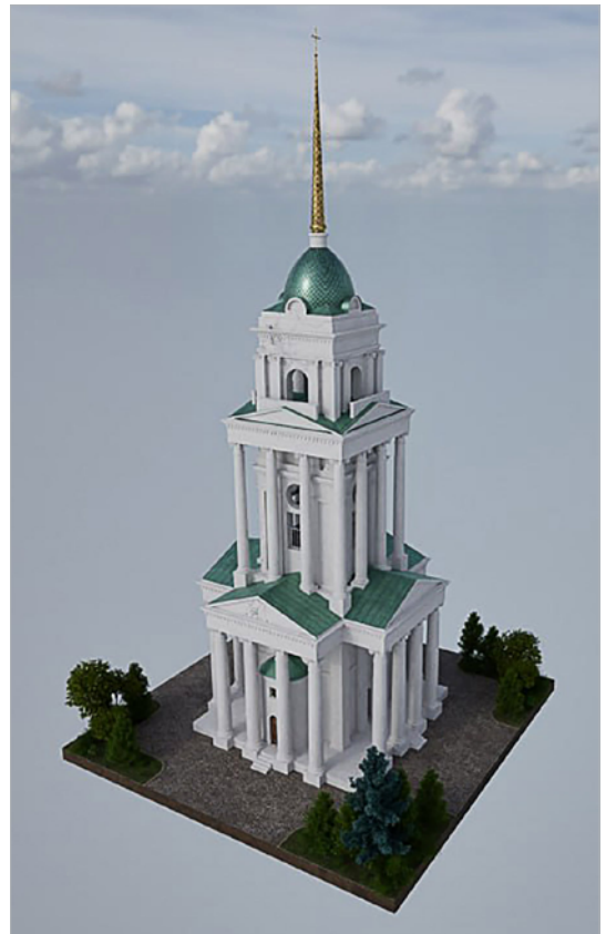
Цифрове відтворення дзвіниці Спасо-Преображенської церкви в Глухові. Рендер моделі

У 1960-х роках під загрозою знесення опинилася навіть сама Спасо-Преображенська церква: за ініціативою Сумського обкому КПУ планувалося «випрямлення» вулиці Путивльської. Храм вдалося зберегти, проте без дзвіниці як вертикальної доміанти ансамбль уже не мав первісної композиційної та просторової рівноваги.