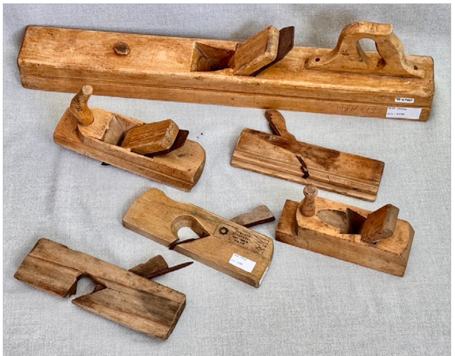
Столярні інструменти ХХ ст., передані до фондів Заповідника

Основу колекції складають дерев'яні рубанки різних типів і розмірів, довжиною від 20 до 25 см. Більшість із них – саморобні інструменти, які столяри виготовляли для власної потреби. Вони мають просту конструкцію: дерев'яний корпус із пласкою підшоною, металеве лезо та клин, яким ніж надійно закріплювався всередині. Рукоятки рубанків відрізняються формою – пере-