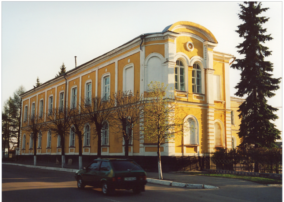
Будинок А. Я. Терещенка у Глухові

У Глухові збереглася резиденція Терещенків, яка є однією з архітектурних окрас сучасного міста. Відомо, що Артемій Якович Терещенко (1794–