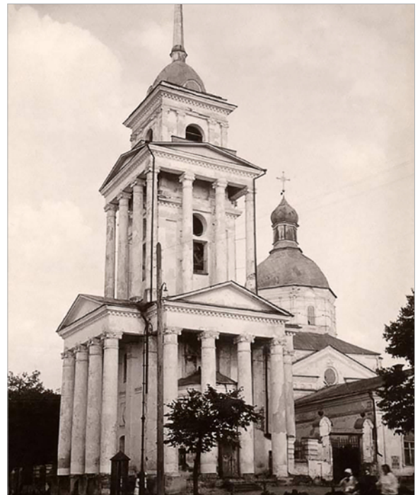
Дзвіниця Спасо-Преображенської церкви в Глухові. Фото С. Таранушенка, 1930 р. Із фондів Інституту рукопису Національної бібліотеки України імені В. І. Вернадського

У середньому та верхньому ярусах були влаштовані аркові прорізи для вільного поширення звуку дзвонів. Найменший за об'ємом верхній ярус був членований пілястрами й завершу-