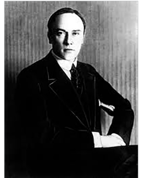
Михайло Іванович Терещенко

В роки Першої світової війни М. І. Терещенко став активним діячем Товариства Червоного хреста, власним коштом відкрив у Києві великий лазарет для поранених. Озброєння для армії закуповувалося на зарубіжну позику, гарантовану майном Терещенка, і за цю позику він сам своїм майном після революції розраховувався.