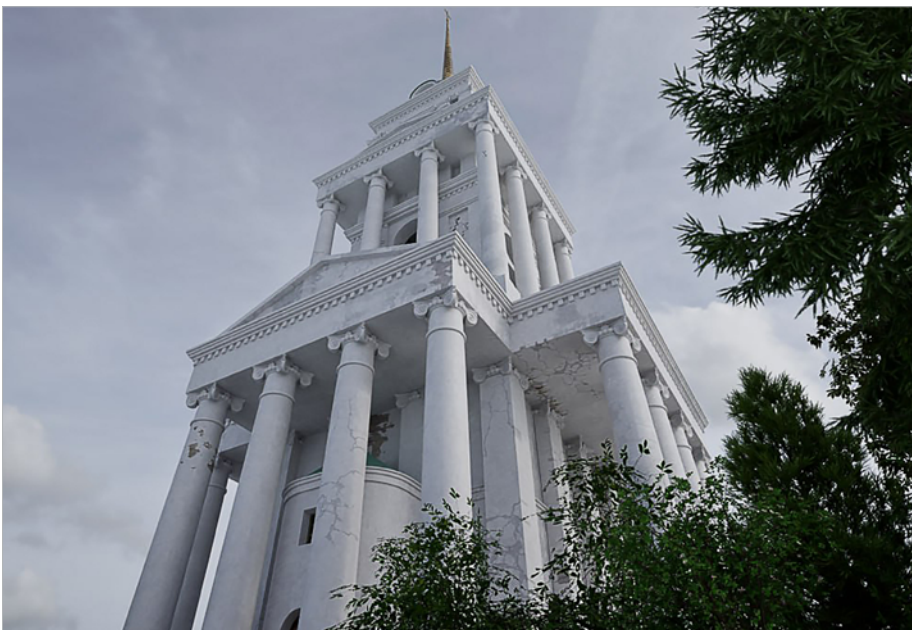
Архітектурні деталі втраченої дзвіниці: колони, фронтони та ярусна структура у 3D-відтворенні

3D-модель дзвіниці можна переглянути тут: https://hlukhivspadok.gnpu.edu.ua/3d-modeli/dzvinyczya-spaso-preobrazhenskoyi-czerkvy-3d-model/