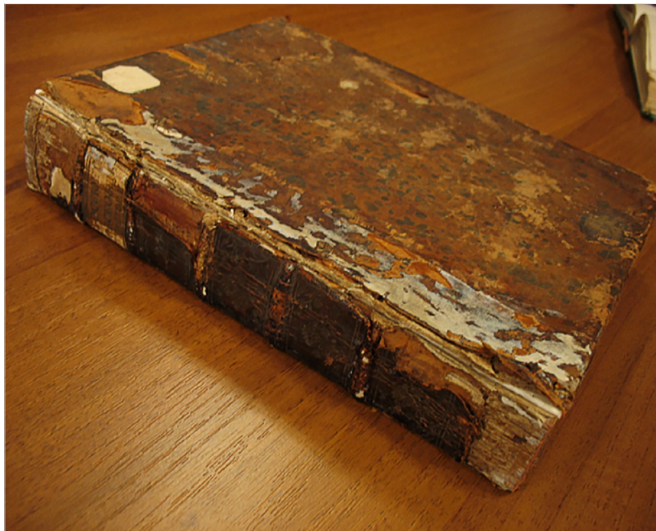
Зовнішній вигляд книги

265-річний ювілей книги Жака Бенінья Боссюта – не лише добра нагода згадати одну з найвідоміших історичних праць ранньомодерної Європи, що нагадує нам про пошук кожним поколінням сенсу і напряму розвитку суспільства. Це також можливість усвідомити, що з плином часу значення друкованої книги для збереження інтелектуального потенціалу людства лише зростає.