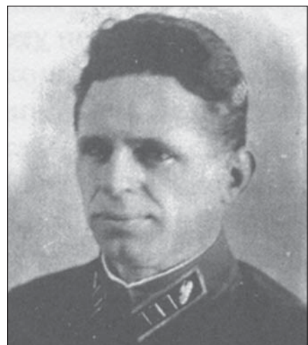
Григорій Сергійович Рудченко

Григорій Сергійович Рудченко народився 12 лютого 1900 р. у м. Суми. З 1918 р. він брав участь у громадянській війні у складі Робітничо-Селянської Червоної Армії (РСЧА) на південному фронті. Після закінчення війни навчався на 7-х Севастопольських артилерійських командних курсах, пізніше – на курсах удосконалення командного складу, потім служив у різних військових підрозділах сухопутних військ. У березні 1933 р. він став слухачем Військової академії механізації та моторизації РСЧА ім. Й.В. Сталіна, по закінченні якої викладав у Полтавському військовому автотехнічному училищі. У 1940 р. Г. Рудченка призначають начальником штабу 31-ї окремої легкої танкової бригади, а у березні 1941-го – начальником штабу 55-ї танкової дивізії 25-го механізованого корпусу Харківського військового округу. На цій посаді Григорій Сергійович і розпочав війну. Він воював на Західному, Центральному та Брянсько-