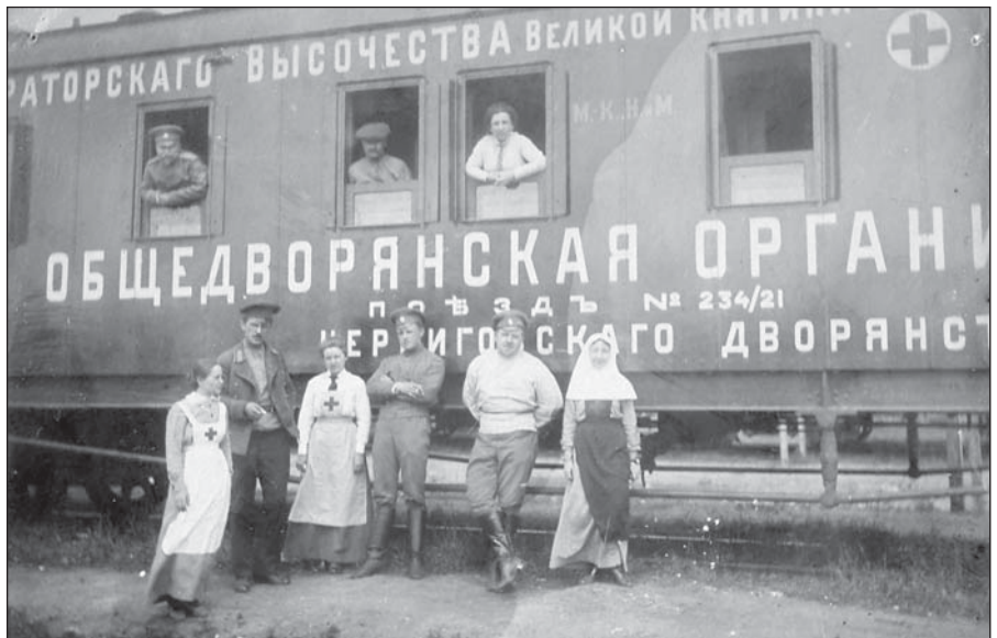
Санитарный поезд им. Черниговского дворянства

В ночь на 1 января 1918 г. город был взят партизанским отрядом во главе с известным комиссаром-матросом В. Цыганком и первым московским красногвардейским отрядом А. Знаменского. Однако вместе с ними в Глухов ворвалась и банда анархистствующих элементов, которые учинили в городе еврейский погром, а также вырезали часть семей местных помещиков, разграбив