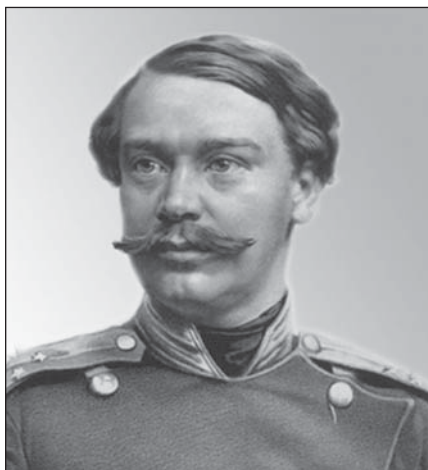
Микола Васильович Гербель

М.В. Гербель не міг не звернути увагу на поетові рядки: «Ти смієшся, а я плачу, Великий мій друже». Року 1852-го біля могили славетного полтавчанина Гербель у своєму вірші повторив бачення Т.Г. Шевченка своїми словами: «Улыбка скрывает печаль и смех заглушает рыдания». Шевченко добре запам'ятав Гербеля. 22 квітня 1857 р. у листі до сина історика України Миколи Маркевича Андрія він запитував: «Чи не зострінешся там часом з Гербелем, перекладчиком Слова о полку Игореві? Воно хоч і зветься Гербель, а такий же сірий хахол, як і ми з тобою, молодий мій друже! Отож як побачиш його, то подякуй йому за переклад Малоросійської думи, надрукованої в «Библиотеки для чтения».