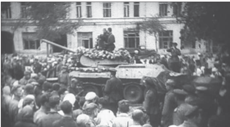
Траурний мітинг під час похорону генерала у Глухові