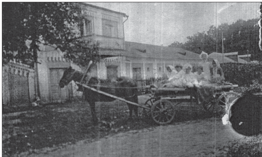
Имение Беков в с. Заруцкое