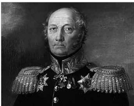
Портрет Андрея Семеновича Уманца кисти художника Джорджа Доу