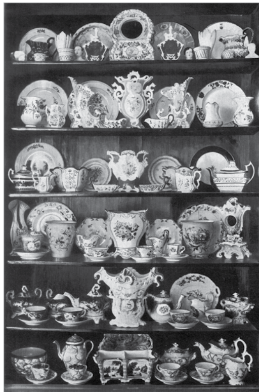
Волокитинський фарфор у колекції Скоропадських (Полошківський маєток). Фото 1914 р.

«Предписание Вашего Превосходительства отъ 13 подъ № 4885 состоявшаяся въ семь суде прошедшаго апреля 17 числа полученное оповещаемо было лично Заседателемъ Суда сего Мис-