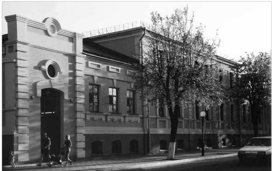
Пам'ятка історії «Безплатна лікарня св. Єфросинії». Сучасний вигляд

Основи фінансової могутності Терещенків були закладені після реформи 1861 р. Саме тоді Артемій зацікавився новою для України цукровою