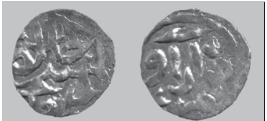
Рис. 1. Данг хана Абдуллаха, карбований у м. Азак у середині 1360-х рр.