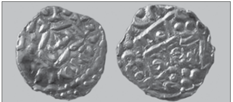
Рис. 2. Сіверське наслідування джучидського дангу хана Мухаммеда-Буляка (1370–1372 рр.)