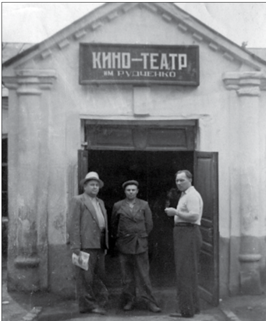
Глуховский кинотеатр в 1950-е годы