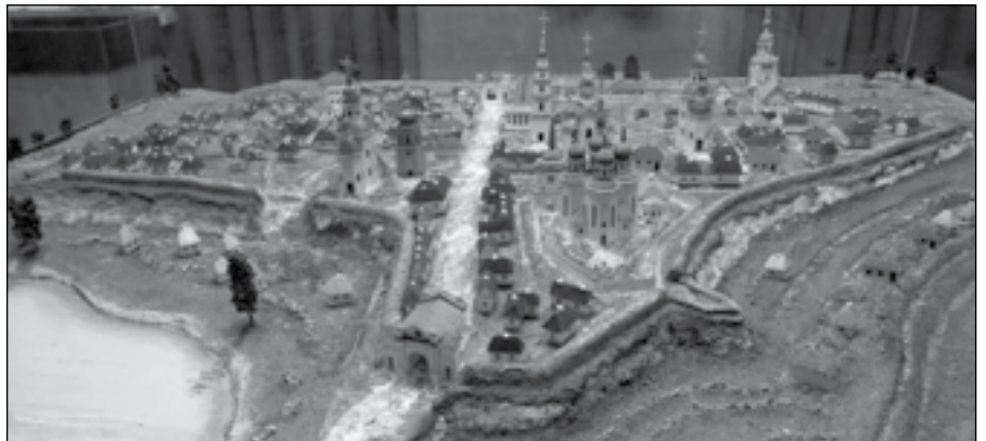
Макет Глухівської фортеці XVIII ст. Музей археології Національного заповідника «Глухів»

ширности: видел я там много каменного строения и каменную соборную церковь. В торжественные дни удивителен мне был, по моим тогашним летам, колокольный в соборной церкви звон, отменный от нашего звона, потому что звонили без перебора на оцепе, всеми колоколами вдруг; также пальба бывала на площади из маленьких чугунных мортир, которые заряжали порохом и заколачивали вместо пыжа пенькового деревянными втулками, от чего происходила по всему городу громкая пальба. Более всего положения места города приметить я ничего не мог, понеже все тогда было покрыто снегом. Немного мы тогда в городе Глухове с своим родственником нагостили: он отпросился в отпуск в дом свой, а при отъезде нашем в возвратный путь купил он три кувфы вина простого не для того, чтоб одного в деревне его было недостаточно,