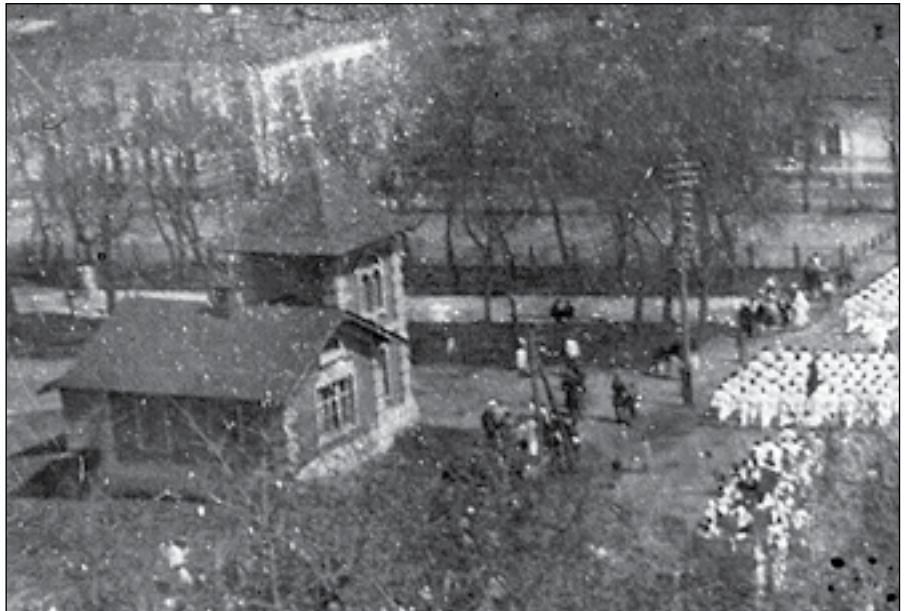
«Теремок». Фото 1920-х років

«Александр Николович Терещенко в письме от 12 июля сего года на имя городского головы, выражая сочувствие Городской Думе по поводу избрания ею места для поставки памятника покойному отцу его, Николе Артемьевичу Терещенко, на площади между церквями Спасской и Трех-Анастасиевской, и желая прийти на помощь Городскому Управлению в приведении означенного места в такое его состояние, которое бы наиболее