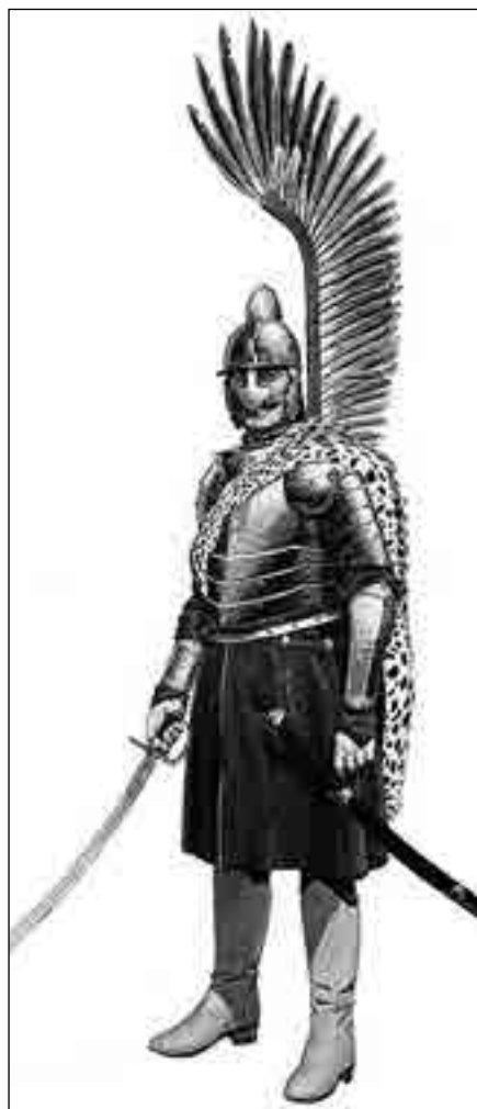
Польський крилатий гусар XVII ст. Реконструкція

В листі п. Samuela Czaplickiego до п. Lubomirskiego, написаного 8 лютого 1664 р., зазначається, що два штурми глухівської фортеці не принесли успіху