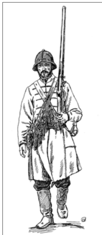
Московський стрілець XVII ст. Реконструкція

У листі п. Johana Magnusa Fon-Ornar до п. Lubomirskiego від 9 лютого 1664 р. наводиться інша дата приходу польських військ під Глухів. За словами автора, це сталося 23 січня 1664 р. Він називає Дворецького полковником, а гарнізон міста – упертими холопами, що не схотіли здаватися на милість королю. Декілька тисяч козаків Івана Богуна, що приєдналися до королівського обозу, не захотіли воювати, і, навіть, не пояснили причини свого рішення. Також у листі наводиться кількість жертв першого штурму, під час якого було вбито сто оберофіцерів, двісті