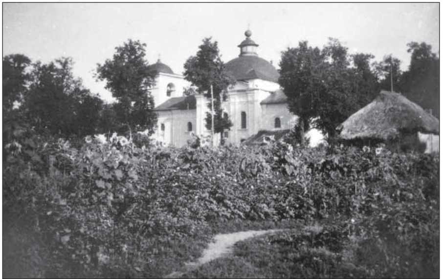
Миколаївська церква в с. Сваркове у 1950-х р.

покрышку нашей приходской церкви, то есть называемой гонты. Для того Вашего Высокопреосвященство просим о перемене приходской нашей церкви деревянной крыши.