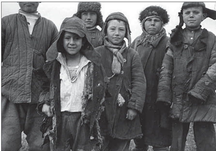
Безпритульні діти 20-х – 30-х років ХХ ст.

неповнолітніх безхатченків направляли на навчання, надавали їм матеріальну допомогу, консультували, призначали опіку, усиновлення, патронат (улаштування в сім'ї для дітей молодшого віку), підлітків працевлаштовували. Також був організований від'їзд на батьківщину безпритульних дітей, які прибули з Росії.