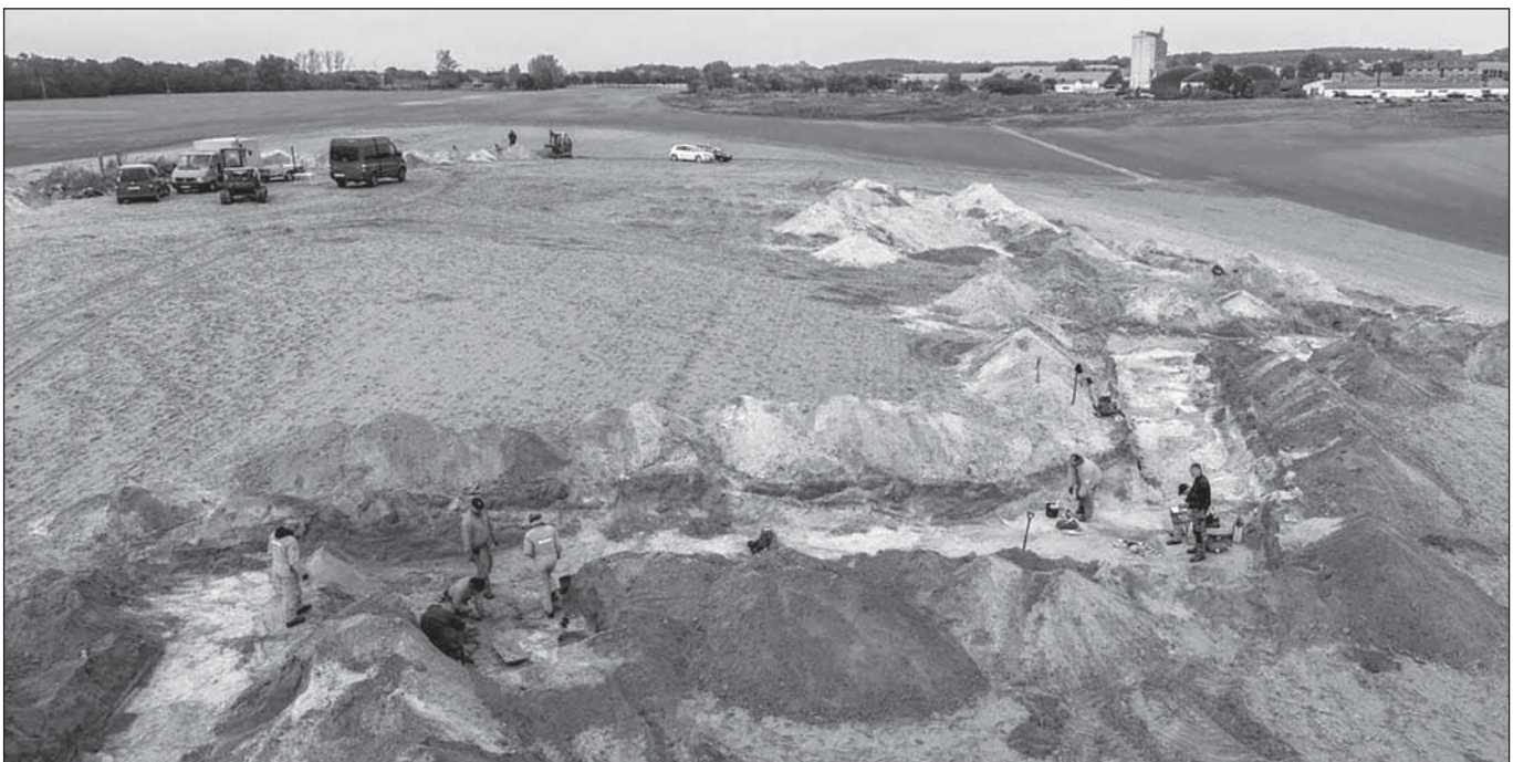
Робочі моменти експедиції

вже надвечір і одразу стали до роботи. Локація, яку нам довелося досліджувати, знаходилася посеред зораного поля біля фермерського господарства Гут Клессін. Місцевий фермер вже кілька років поспіль дозволяє дослідникам з V.B.G.O. проводити розкопки на своїх землях. Як ми зрозуміли пізніше, саме тут був, так би мовити, стартовий майданчик, відкля радянські війська почали наступ на знамениті Зеєлівські висоти. До них від досліджуваної нами позиції було всього пару кілометрів. Працювали на розкопі з колегами з Оксфорду. Коли ми до них приєдналися, вони вже виявили рештки радянського бійця. Поряд