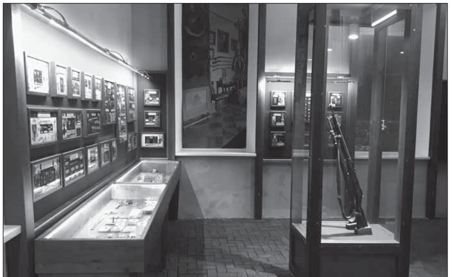
Фрагмент експозиції виставки «З історії стрілецької зброї»

Останні реставраційні роботи пам'ятки проводились у 2007 р. Відтоді Заповідником виношувалась ідея її музеєфікації. Першим етапом реалізації цієї ідеї стало відкриття 30 серпня 2013 р., у день 70-річчя визволення Глухова від німецько-фашистських загарбників, експозиції постійно діючої виставки «Миттєвості Великої війни» у правій бічній кордегардії. За підтримки Міністерства культури України, яке цього року профінансувало ремонтні роботи лівої бічної кордегардії і виготовлення експозиційного обладнання (175 тис. грн.), завершена повна музеєфікація