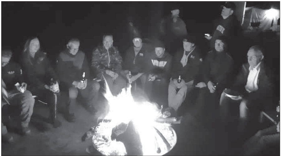
Пошуковці після робочого дня за душевними розмовами

Міжнародні пошукові експедиції в означеному місці проходять вже дев'ятий сезон. Організатором їх є Асоціація з пошуку та поховання загиблих у Східній Європі (Verein zur Bergung Gefallener in Osteuropa (V.B.G.O.)). У цьому році в роботах взяло участь 40 волонтерів із восьми країн – Німеччини, Англії, Голландії, Швейцарії, Польщі, України, Білорусії та Росії. До експедиції, у складі групи із Всеукраїнської громадської організації «Союз «Народна пам'ять», почастило