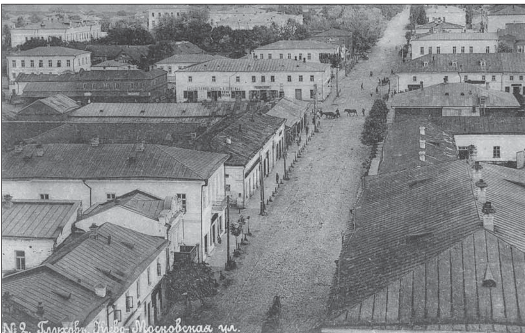
Глухів на початку XX ст. Вид на Києво-Московську вулицю з дзвіниці Троїцького собору

Державний архів Чернігівської області, ф. 127, оп. 10, спр. 2228