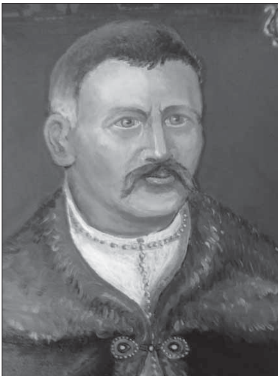
Іван Мануйлович, глухівський сотник 1714–1728 рр. Картина з фондів Глухівського міського красназавчого музею, художник Юрій Мануйлович

Яків (Ясько) Жураковський (Жураховський) (?–1704) – військовий діяч часів Гетьманщини, був сотником глухівським, а згодом полковником ніжинським. Значиться серед тієї козацької старшини, яка підписала Глухівські статті 1669 р., відзначився у боях проти турецько-татарського війська,