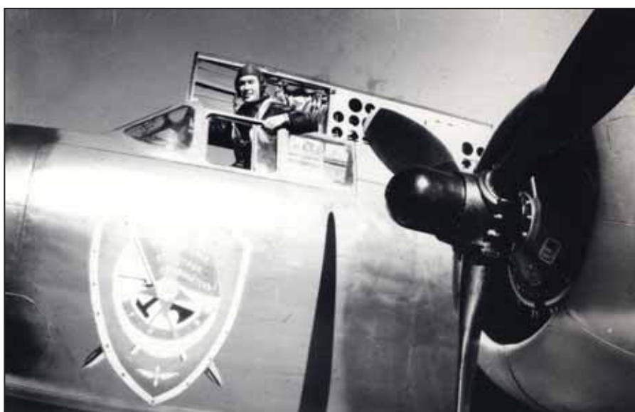
Американский бомбардировщик Бостон из состава 221-й БАД, который принимал участие в освобождении Глухова

В течение 3-х дней (2, 3 и 4 сентября 1943 г.) немцы не бомбили